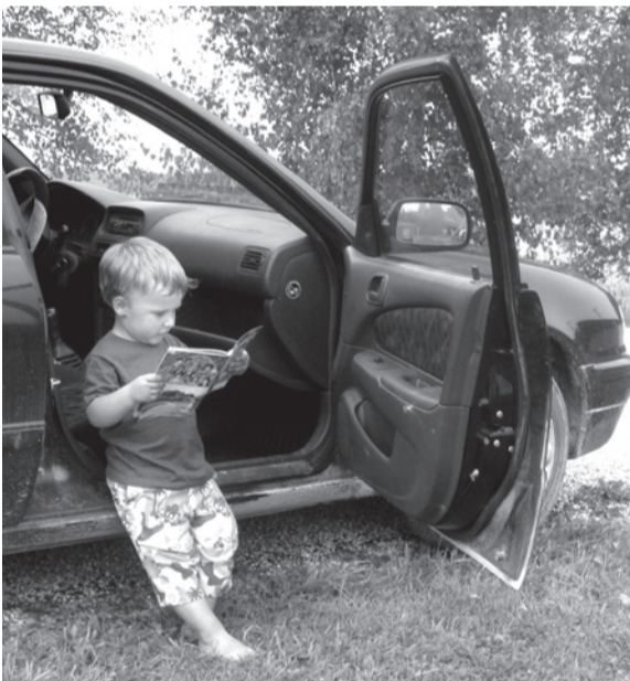
Nii huvitav raamat see Kuhjavere raamat