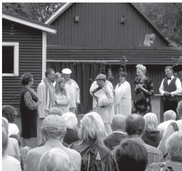
Avinurme Suveteatri PUHKEPÄEV lõpusirgel