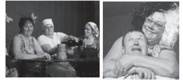
Kandvad rollid „Naisvallavanemas“.

Saadud tulu läheb projekti "Aitame liikumispuudega lapsi kõndima" toetuseks