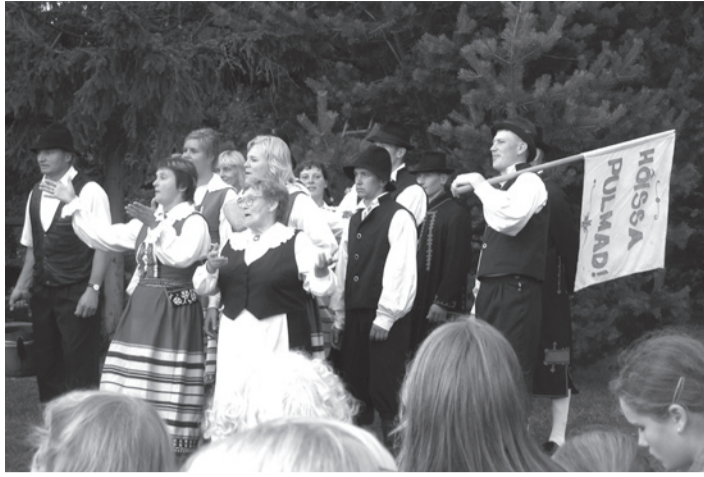
Pulmad võivad alata