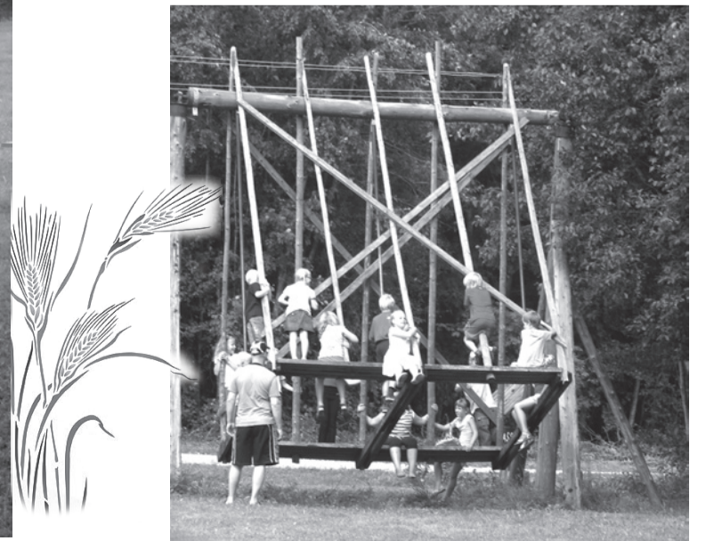
Külakiik - laste ajaviide