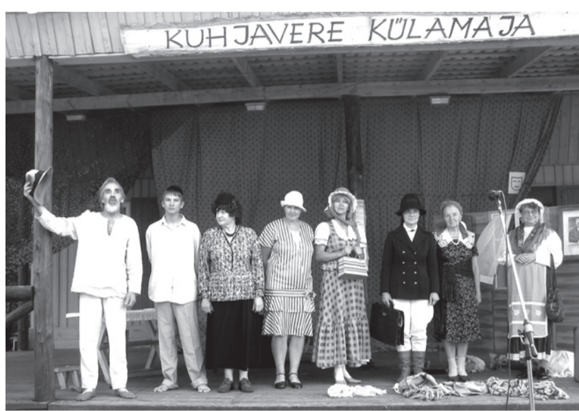
Vastseliinas Vana Habe Näitetrupilt ONU PAREMAD PÄEVAD