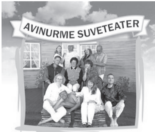
"ON SEAL KEEGI?"

Kõik näidendid on kõvasti kärbitud. Tänu sellele on etendused põnevamad ja tihedamad, sest kõik vähemoluline on välja jäetud.