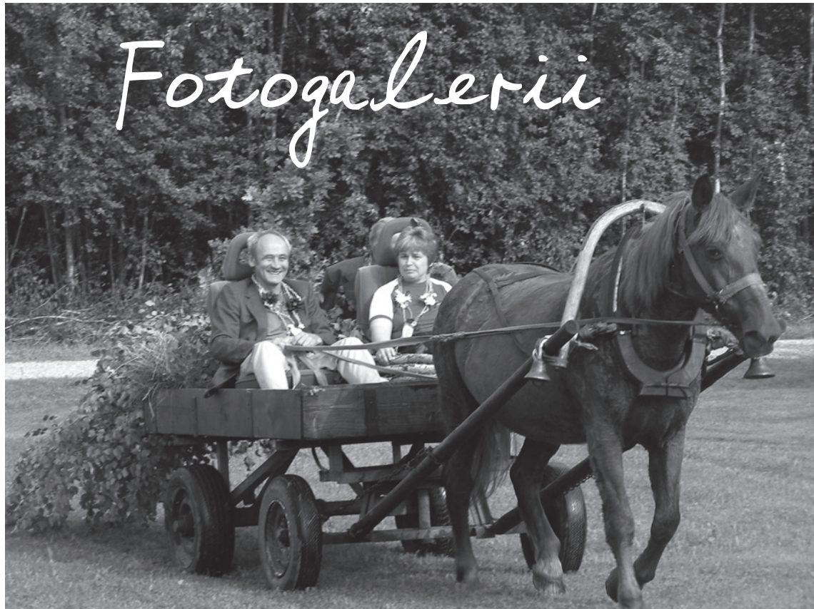
Külavanem sõidab avamisele