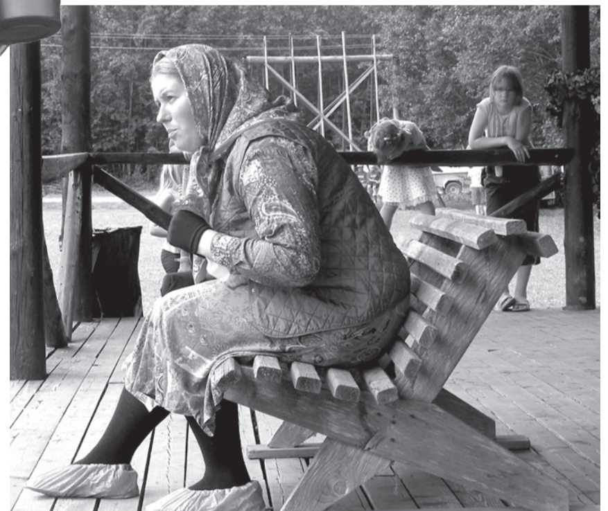
Suure-Jaani KUUS MONOLOOGI RAHA ASJUS