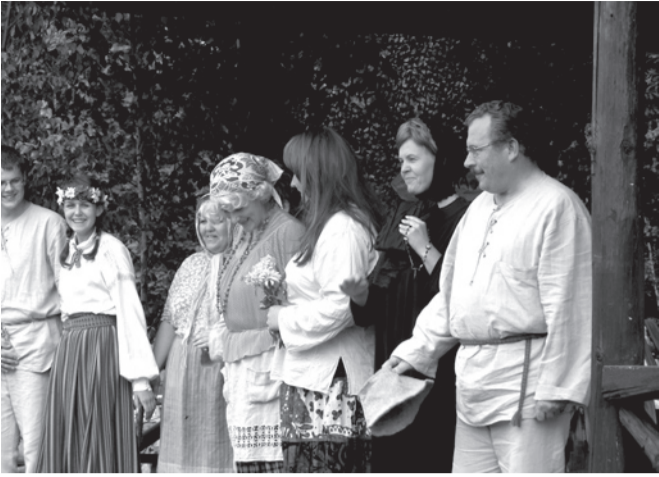
Sulbi Külateater esitas VAHELIKU PROUA VAPUSTUSI