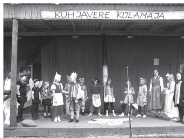
Noorimad esinejad Abjast