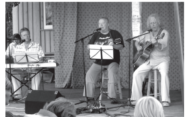
Päeva lõpetas lustlik KULDNE TRO