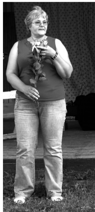
Suure-Jaani vallavanem Maie Käba