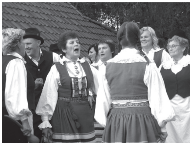
Kõlavad Mustjala pulmalaulud