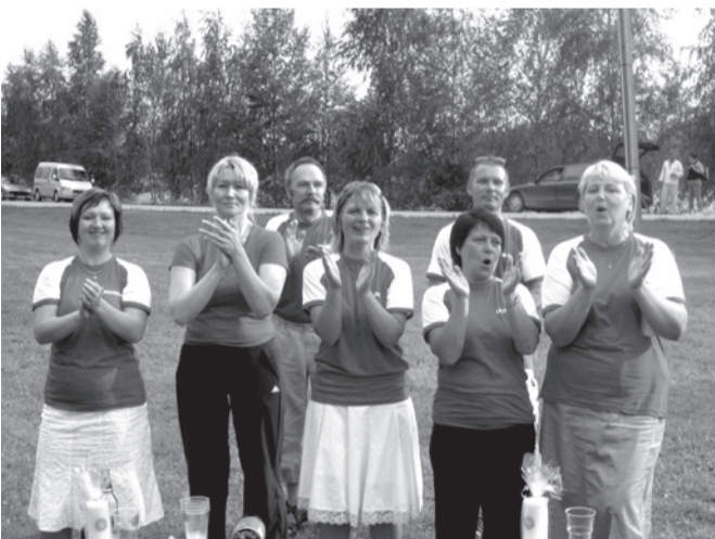
Publik on rahul