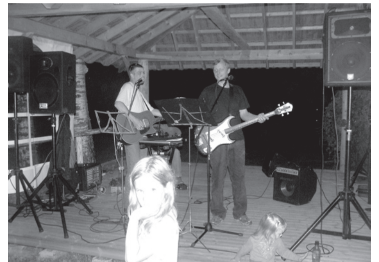
Simman Priidu ja Anti pilli järgi kestis uude päeva