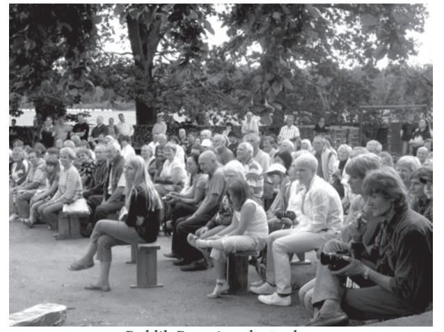
Publik Passaia talu õuel