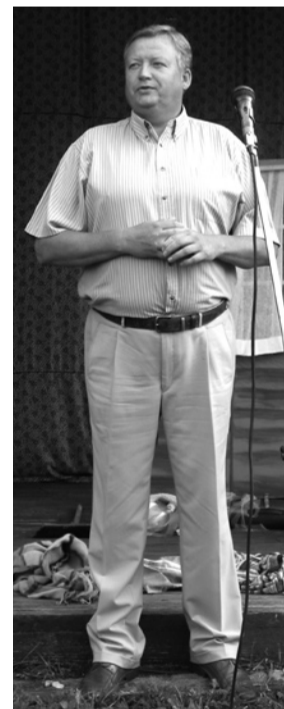
Avasõnad Riigikogu liikmelt Peep Arult