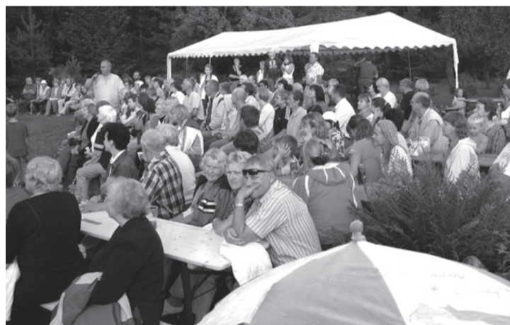
Publik MUSTJALA PULMA ootel