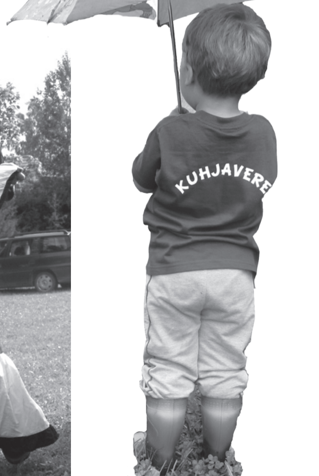
Kuhjavere Külaseltsi liikmed kandsid nimelisi särke