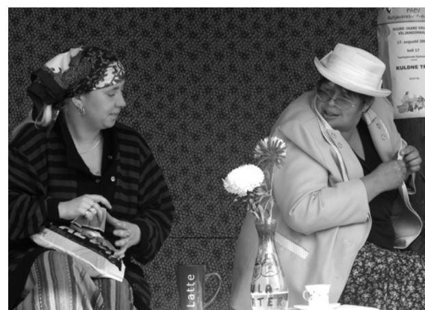
Krabi Külateatri KIIKSU KOHVIK