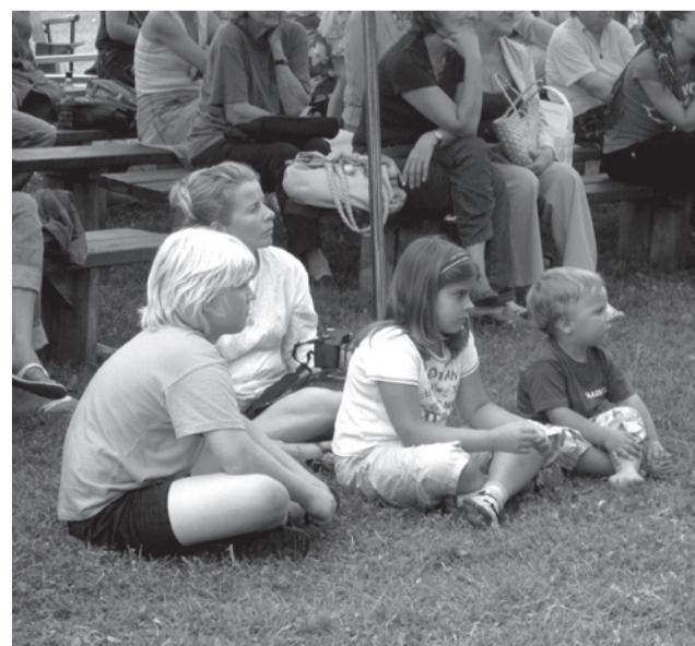
Etendus nõuab täit tähelepanu