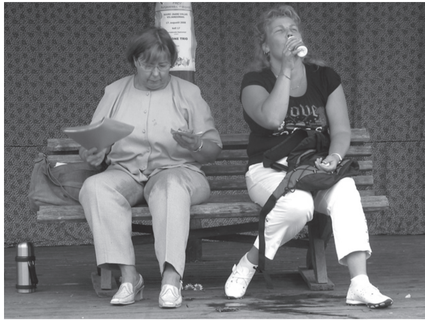
Muuga Maanaisteseltsi PARGIS