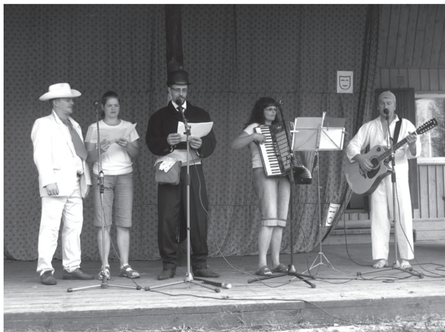
Tänassilma Pupu-Jukud lisasid särtsu laulu ja pillilugudega