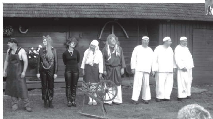
Pilistvere Põrpijad mängisid KALEVIPOEGA