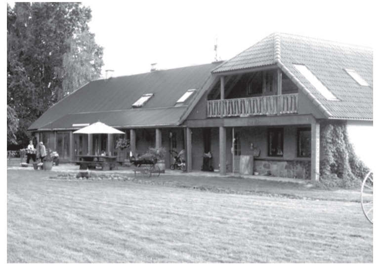
Uus mängupaik Kuhjaveres - Alt-Siimu talu õu